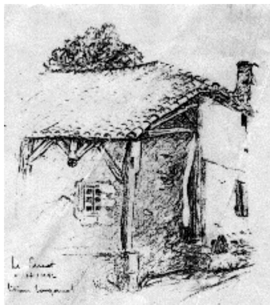
La Ferme du Parcot MAISON DE LA DOUBLE

Centre d'Initiation à l'Architecture Rurale et à l'Environnement ECHOUGNAC, 24410 SAINT AULAYE Téléphone : 05 53 81 99 28, Télécopie : 05 53 58 88 22